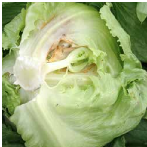
Bild 5. Orsaker till att produkter kasseras och förluster uppstår. Till vänster isbergssallat där huvudet inte är slutet och till höger isbergssallat angripen av inre röta.