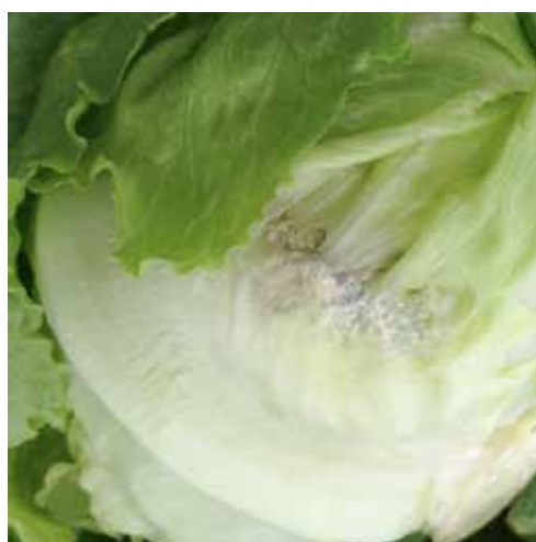
Bild 6. Orsaker till att produkter kasseras och förluster uppstår. Till vänster isbergssallat skadad av fågel och till höger isbergssallat angripen av skadegörare.