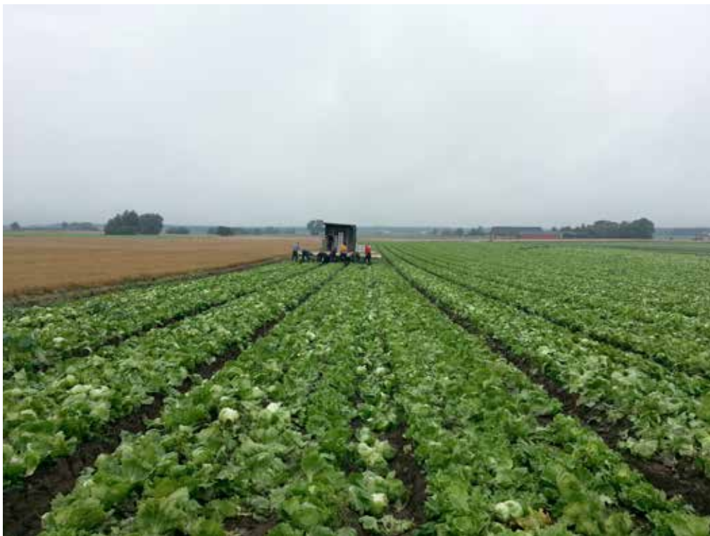
Bild 1. Skörd av isbergssallat. Sallatshuvudena paketeras och läggs i låda direkt på fält.

Skörd av isbergssallat pågår i Sverige vanligen under maj/juni-oktober, även om säsongen kan vara förskjuten beroende på väderförhållanden. Sallatshuvudena skördas manuellt och förpackas i påse direkt på fält. Vanligen går skördepersonalen efter en traktor försedd med lastflak för lådor med skördade produkter (Bild 1). Mindre producenter kan istället skörda och paketera direkt i lådor placerade på fältet. Produkterna skärs av för hand, strax ovanför de nedersta bladen som lämnas kvar, huvudena trimmas på något/några blad och stoppas därefter direkt i påsförpackning och ner i lådan. Sallatshuvud som är missformade, av fel storlek eller inte knutna lämnas kvar på fältet. Upptäcks något fel på huvudet direkt vid skörd kastas detta tillbaka på fältet. Ofta plöjs fälten strax efter skörd av sallaten, så att resterande biomassa myllas ned.