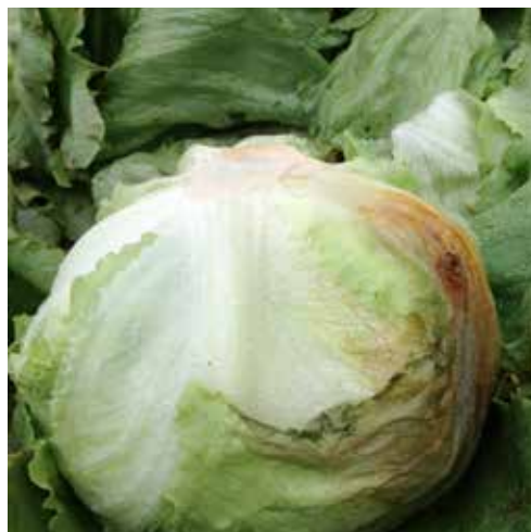
Bild 4. Orsaker till att produkter kasseras och förluster uppstår. Till vänster isbergssallat angripen av kantbränna (eng. tipburn) och till höger isbergssallat angripen av röta.