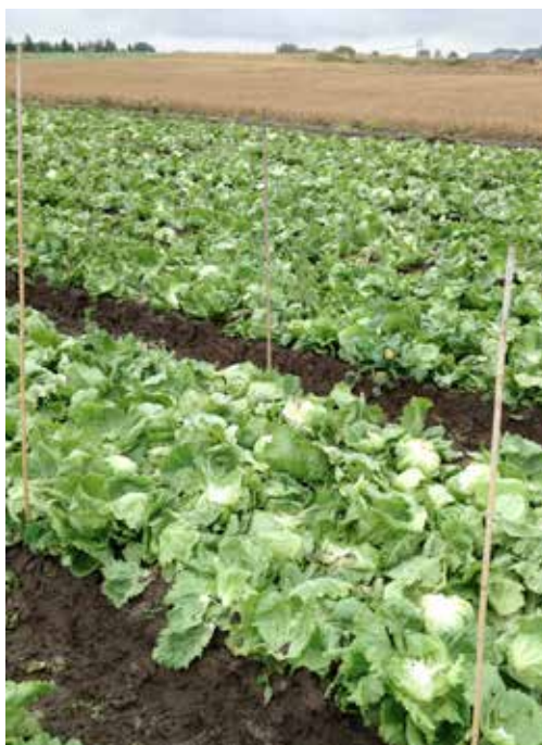
Bild 2. Nyss skördat fält med en försöksruta utmärkt med pinnar, 1,5 x 1,5 m.

Total vikt i kg friskvikt av kvarlämnat efter skörd av isbergssallat: hela huvud, bortrensat av yttre blad samt de undre bladen som inte skördas. Hos varje odlare undersöktes och vägdes tre rutor om 1,5 x 1,5 meter, eller mindre rutor om radbredden var mindre (1,2 x 1,2 eller 1,4 x 1,4 m), och kvarlämnad vikt per kvadratmeter beräknades. Undersökningarna utfördes på fält som var precis innan skördade. ( Bild 2 )