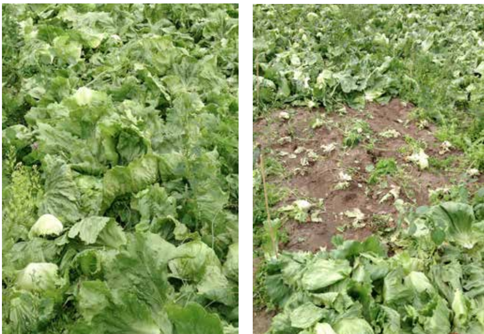
Bild 3. Till vänster, en nyligen skördad del av fält. Till höger, en provruta efter att kvarvarande sallat insamlats.

Fältundersökningen genomfördes på fält som för mindre än en timma sedan skördats av producenten, för att erhålla en så korrekt uppskattning av färskvikten som möjligt. Material packades i plastpåsar och vägdes direkt i fält, förutom vid provtagning hos odlare 1 vilket packades i plastpåsar och transporterades till laboratorium för vägning och inspektion inom loppet av två timmar. Vid uppskalning av massan av kvarlämnad isbergssallat samt kvarlämnade isbergssallatshuvud på fält från kvadratmeter till hektar (Tabell 1 och 2), har hänsyn tagits till yta som inte är odlad på fälten, och värden per hektar har reducerats i enlighet med detta. Utifrån ett uppskattat bäddavstånd på 40-50 cm, samt de uppmätta bäddbredder 120, 140 och 150 cm hos de undersökta odlingarna, samt något ytterligare tillägg för kanter på fälten, så har bortfallet av icke-odlad yta på fälten uppskattats till 25 procent av total yta, och bortfall av isbergssallat per hektar reducerats i enlighet med detta,