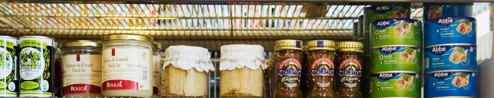
326,- Ankfett 320g 32,- Rouge 320g 1 frankrike Vit tonfisk 95,- Casa Grande 280g Sardeller lyx 79,- Oriba 55g Sardeller 46,- Italien 95g Tonfisk i solrosolja 55 Abba Tonfisk i vatten 21 Abba