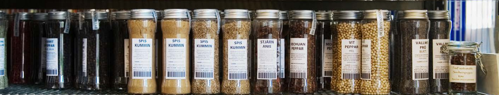
Rosépeppar 38,- Kryddlagret Svartpeppar hel 38,- Kryddlagret Spiskummin 38,- Kryddlagret Stjärmanis 38,- Kryddlagret Vitpeppar 38,- Creamy white mustard Kryddlagret Vallmöfrö blå 38,- Kryddlagret