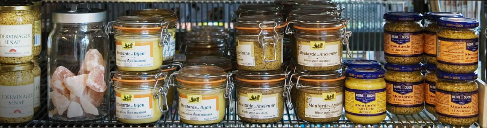
Himalaya salt 16,-/kg Lössika Dijon senap 28,- Dijon senap 42,- Extra stark Beaufor Dijon senap 42,- Grov Beaufor Dijon 22,- Reine Dijon grov 22,- Reine

© Livsmedelsverket, Uppsala oktober 2017 ISBN: 978 91 7714 221 8 Layout: Byrå4, Uppsala Tryck: Lenanders Grafiska