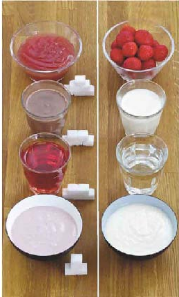
ካብ ድጉል መጻወድያ ሽኮር ምጥንቃቕ የድሊ፣ ንደቅና ምስ ሽኮራዊ ዘይኮነስ ምስ ካልእ ዓይነት መግብታት ነላልዮም፣ ኣብ / ዚ ወገን ጸጋም ዘሎ ስእሊ. "ፍሩክትዮፕርት" ጽማቕ (ሳፍት) መስተ ቸኮላታ ክፈማን ክንደይ ዚኣክል ሽኮር ከም ዘለዎም ትምልከት።

ዝተፈላለዩ ውጽኢታት መግቢ ክንደይ ዝኣክል ሽኮር ከም ዝኣተዎም ኣብ መግቢኦም ተመልከት፣ ዓይኒ መፍትሕ ዘለዎም መግብታት / ውን ክትመርጽ ትኻእል ኢኻ፣ ብምልክት ዓይኒ መፍትሕ። መመዋሪ ዘይብሎምን። ውሑድ ሽኮር ጥራይ ዝሓዙን ውጽኢታት ፍሊንጉርን ርጉኦን ጥራይ ይምልከኡ፣