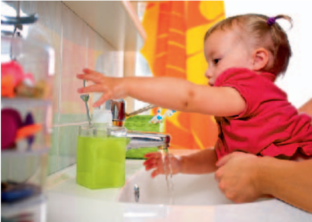
ምስ ቆልዑን ንቆልዑን መግቢ ክትሰርሕ ክለኻ ኣብ ጽሬት ዝያዳ ኣቃልቦ ምግባር የድሊ።