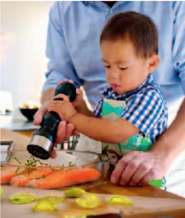
ቐልዮ ኣዘውቲሮም ዓሳ ኪበልዑ ጽቡቕ' ዩ። ንኣብነት 2-3 ሳዕ ንሰሙን።

ኣብ ኣካል ሰብ ምስ ኣተወ ናብ ዴዎኦኦ (ዴኮሳሄክሳናዊ ኣሲድ) ዚቕየር ስብሐ ኦሜጋ- 3 ኣለዎም፤ ፍረ ጀዝን (ቫልፍት) እንጣጢዕን' ዉን ኦሜጋ-3 ኣለዎም።