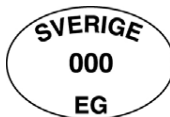
Kontrollmärke (minst 6,5 x 4,5 cm)

Slaktkroppar, parter av slaktkroppar och slaktbiprodukter som produceras vid slakteri eller vilthanteringsanläggning är undantagna från reglerna om identifieringsmärkning. I stället finns regler om att märkning ska ske där med ett så kallat kontrollmärke, som ett led i den offentliga kontrollen. Kontrollmärket är i regel ovalt. Avsikten med