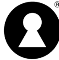
Svart symbol med svart ®-märke