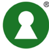
Grön symbol med svart ®-märke

får användas tillsammans eller var för sig i anslutning till nyckelhålet (utanför frizonen). Se exemplen.