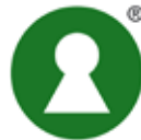
www.nyckelhalet.se Livsmedelsverkets symbol