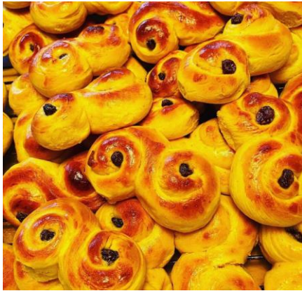
Figur 1. "Lussekatte"