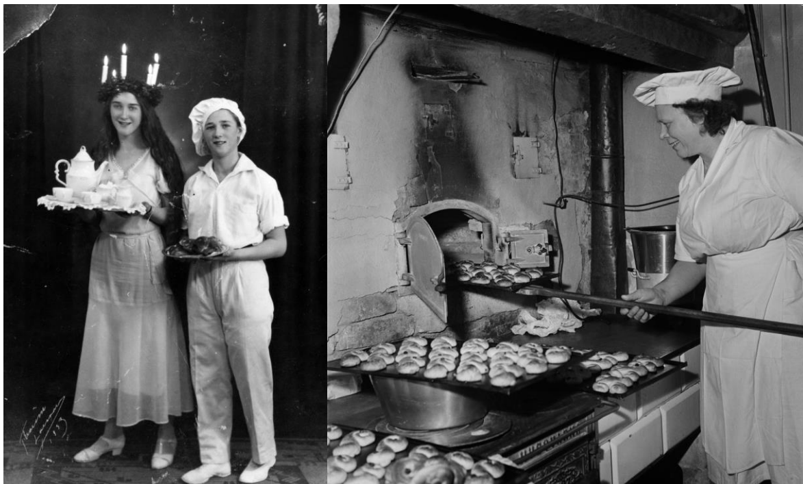
Figur 3. Under 1900-talet befasts och standardiseras de svenska traditionerna med luciafirande och "Lussefatt". Till vänster: En lucia och en bagare med "Lussefatt", 1933, Alingsås museum. Till höger: Bakning av "Lussefatt" i Uppsala 1957, Upplandsmuseet.

Idag är "Lussefatt" ett av svenskarna älskat bakverk. "Lussefatt" säljs under en begränsad tid i december med kulmen under firandet av Lucia den 13 december. Försäljningen av antal "Lussefatt" under Lucia uppskattas uppgå till ca 8 miljoner.