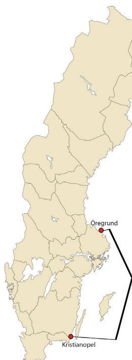
Figur 1. Det geografiska området sträcker sig från Kristianopel i söder till Öregrund i norr.

Det geografiska området avgränsas i söder av Kristianopel i Kalmarsund och en rakt östlig linje till gränsen för den svenska ekonomiska zonen, i öster av den svenska ekonomiska zonen (i figur 1 markerad i fet heldragen linje) i norr av en rakt östlig linje från Öregrund till den svenska ekonomiska zonen och i väster av kuststräckan och dess samhällen (d.v.s. även landet närmast havet – 1 km in i landet, där landning och beredning av ”Ostkustströmming” sker, ingår i det geografiska området).