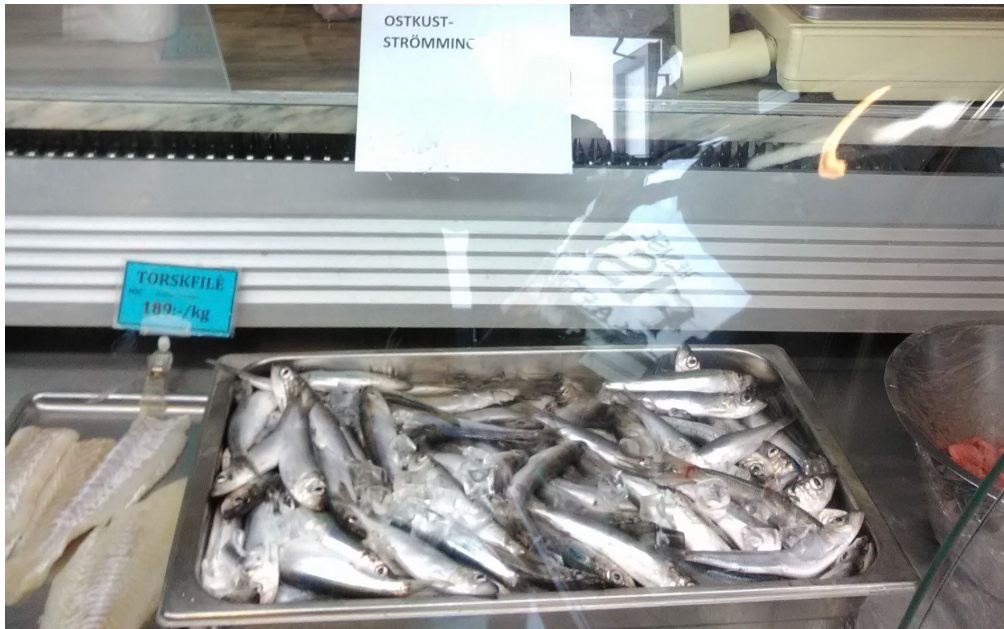
Figur 3. Färsk "Ostkustströmming" till salu i fiskaffär på Gotland.