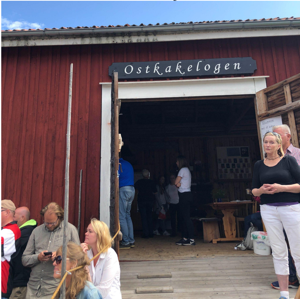
Bild 2. Ostkakeloge med servering av Hälsingeostkaka på Forsa Forngård.

Förutom att självklart serveras i anslutning till Hälsingegårdar är servering av "Hälsingeostkaka" vid de stora spelmansstämorna i området en annan viktig arena för "Hälsingeostkakan". Hälsingegårdar, Spelansstämor och "Hälsingeostkaka" illustrerar alla tre den stora vikt som läggs vid kulturtraditioner i just Hälsingland. Men "Hälsingeostkakan" har i takt med ökat välstånd också gjort en klassresa som innebär att den numera inte bara serveras till fest utan också till vardags.