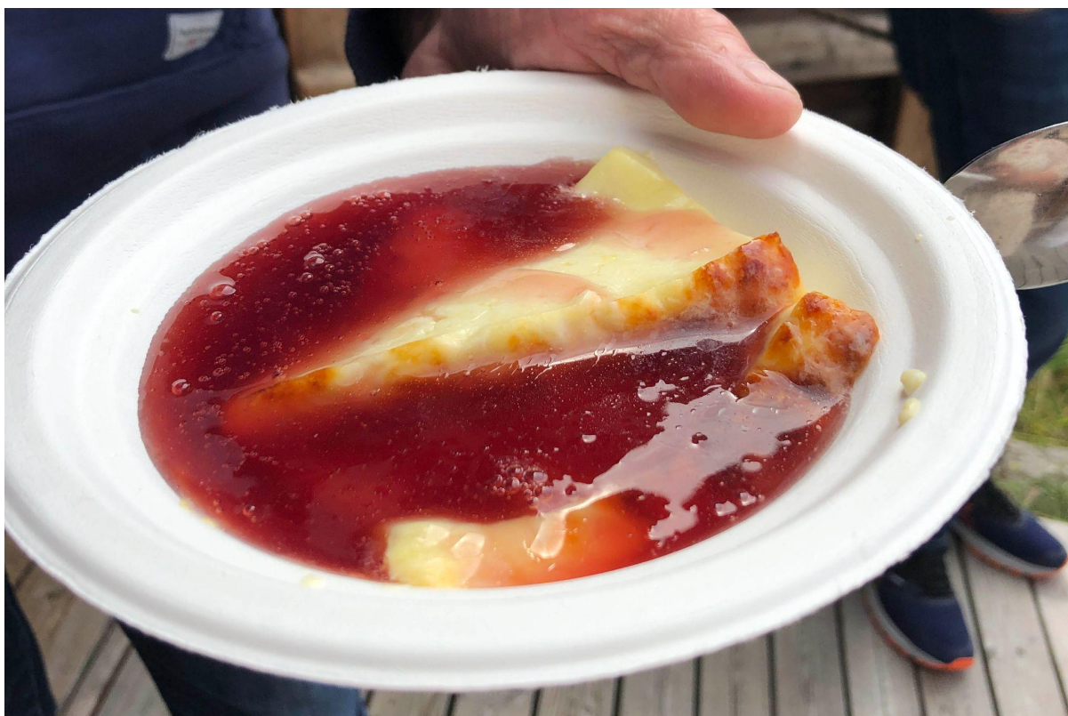
Bild 1. Hälsingeostkaka skuren i skivor och värmd med lite ovispad grädde och serverad tillsammans med saftsås.