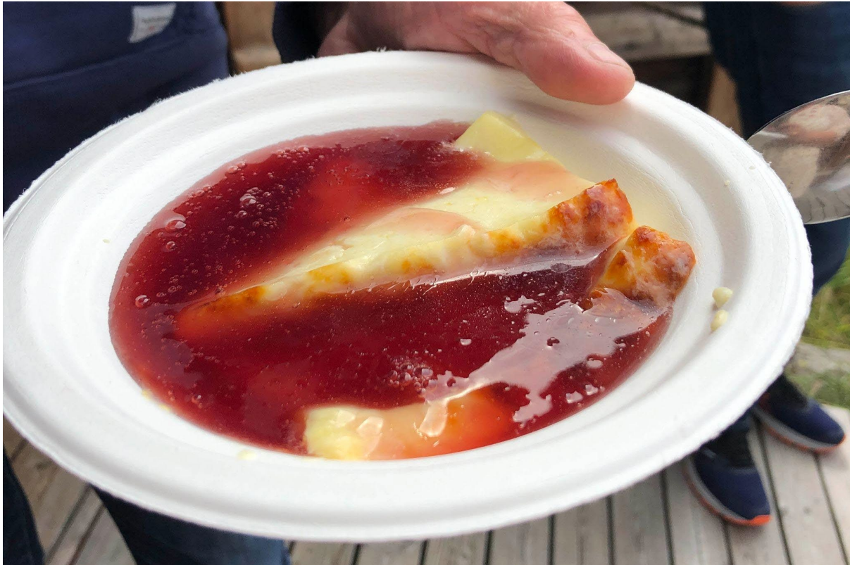
Bild 1. "Hälsingeostkaka" skuren i skivor och värmd med lite ovispad grädde och serverad tillsammans med saftsås.