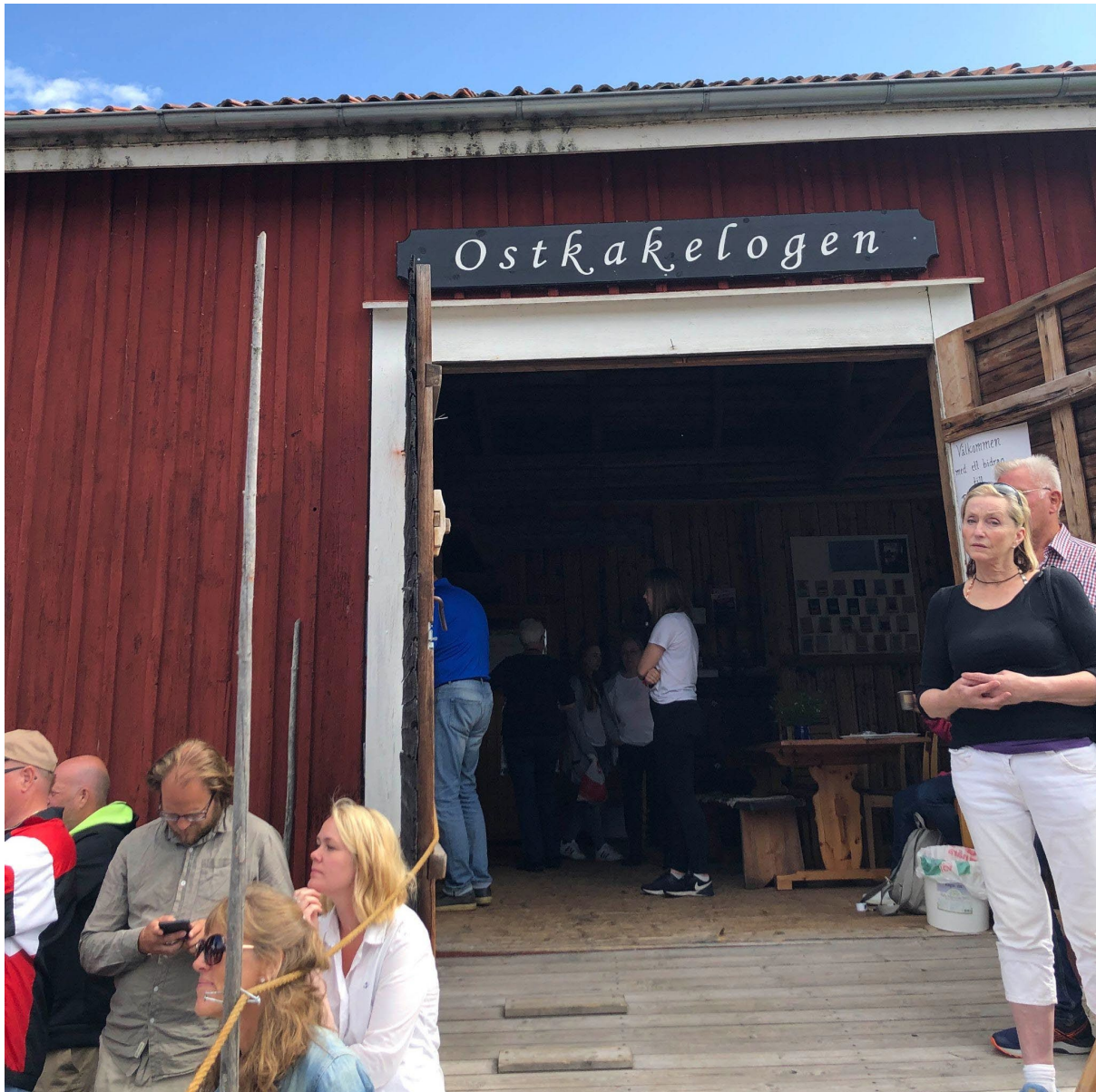
Bild 2. Ostkakeloge med servering av Hälsingeostkaka på Forsa Forngård.