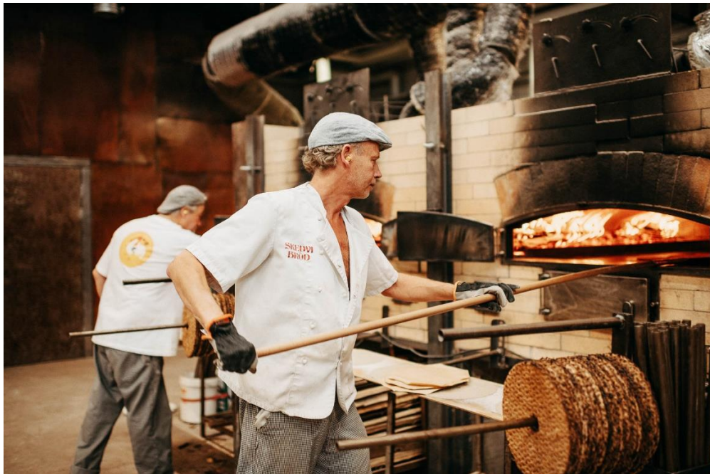
Gräddning av Skedvi Bröd 1