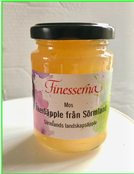
Figur 5: Mos av "Åkeröpple från Sörmland"