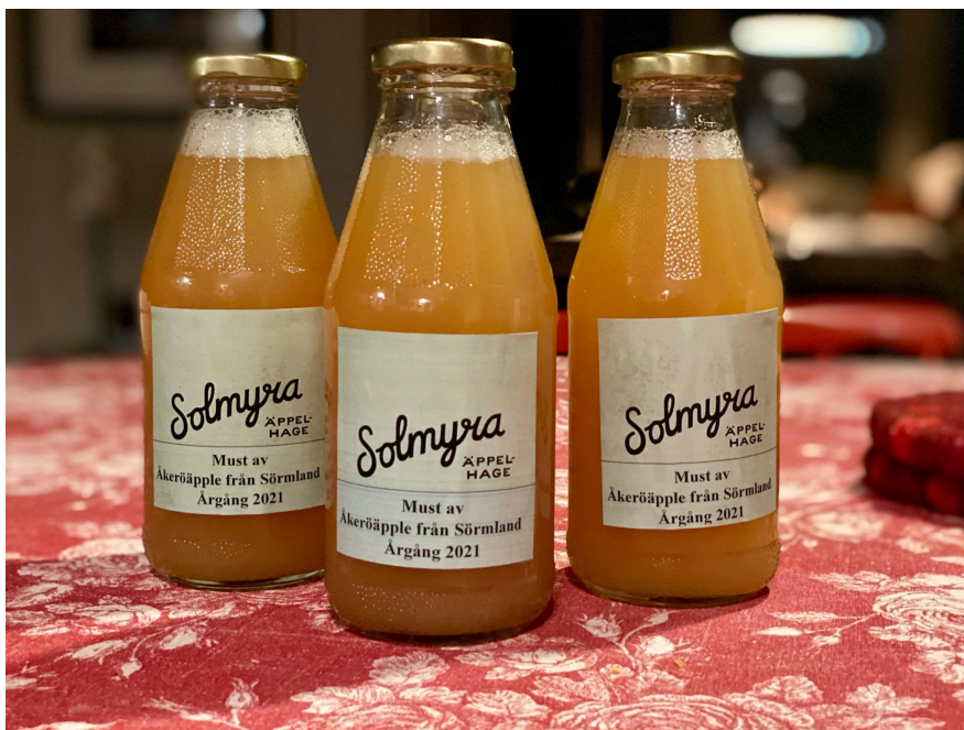
Figur 4. Must av "Åkeröäpple från Sörmland" klar för försäljning

Must av "Åkeröäpple från Sörmland" kan indelas i två kategorier