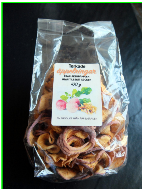
Figur 6. Torkade fruktringar av "Åkeröpple från Sörmland"

Smak: Sötsyrligt koncentrerad med tydligt ursprung, fruktsoppa.