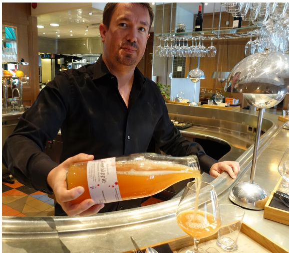
Figur 3. Must av "Åkeröpple från Sörmland" serverad på Restaurang Mathias Dahlgren, Grand Hôtel, Stockholm

Äpplen som är avsedda för förädling omfattas av alla krav i produktspecifikationen för färsk frukt utom klass, storlek och fasthet. Dessa frukter får bära beteckningen "Åkeröpple från Sörmland" vid försäljning till förädlare.