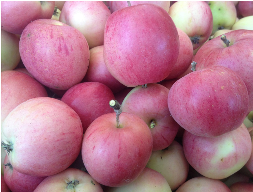
Figur 1. "Åkeröäpple från Sörmland"

Doft: Doften från skalet är stramt fräsch med träigt inslag, fruktköttet doftar fruktigt kryddigt åt kanelhållet med ett kärnhus som doftar moget blommigt.