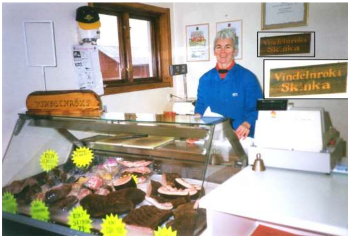
Bild från rökeriets butik med skylten "Vindelrökt Skinka" (1992). Äldre bildbevis på användningen av namnet Vindelrökt skinka förstördes i branden 1991.