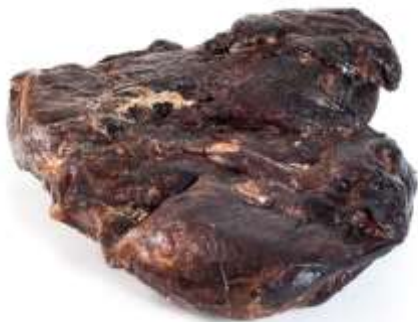
Flatrökt "Vindelrökt skinka"