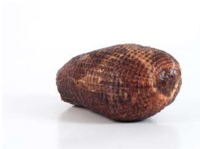
Nätad "Vindelrökt skinka"