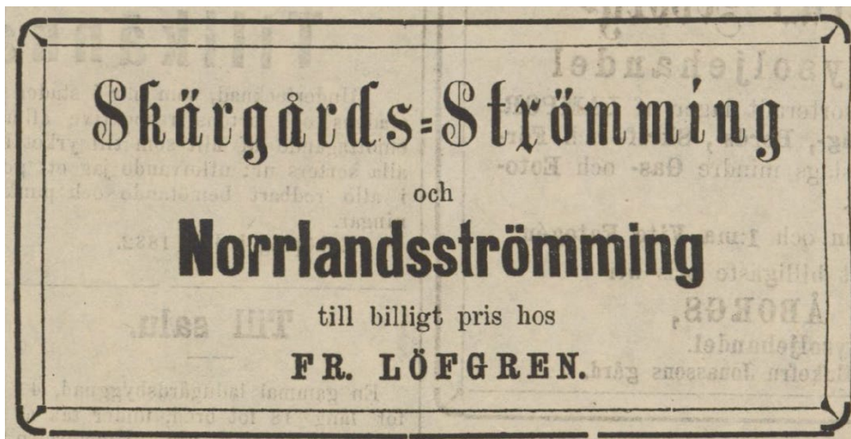
Figur 3. Annons för Norrlandsströmming i Enköpings tidning 1882-10-11.

Namnet ”Norrlandsströmming” dyker första gången upp i svenska dagstidningar år 1813 och används flitigt som ett handelsnamn i annonsering särskilt från 1870-talet och till tidigt 1940-tal. Figur 3 ger ett historiskt exempel medan Figur 4 och 5 ger aktuella exempel.