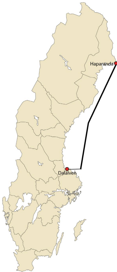
Figur 1. Det geografiska området sträcker sig från Dalälvens mynning i söder till Haparanda i norr.