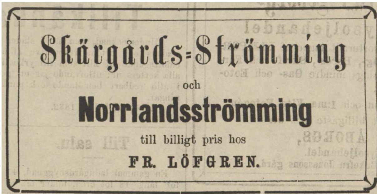
Figur 3. Annonser för Norrlandsströmming i Enköpings tidning 1882-10-11.

Namnet "Norrlandsströmming" dyker första gången upp i svenska dagstidningar år 1813 och används flitigt som ett handelsnamn i annonsering särskilt från 1870-talet och till tidigt 1940-tal. Figur 3 ger ett historiskt exempel medan Figur 4 och 5 ger aktuella exempel.