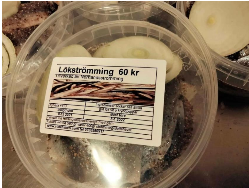
Figur 4. "Lökströmming av Norrlandsströmming" – exempel på hur handelsnamnet används idag.