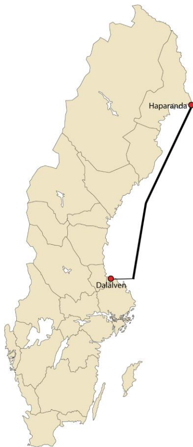
Figur 1. Det geografiska området sträcker sig från Dalälvens mynning i söder till Haparanda i norr.