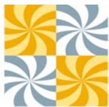
Folkets Hus och Parker