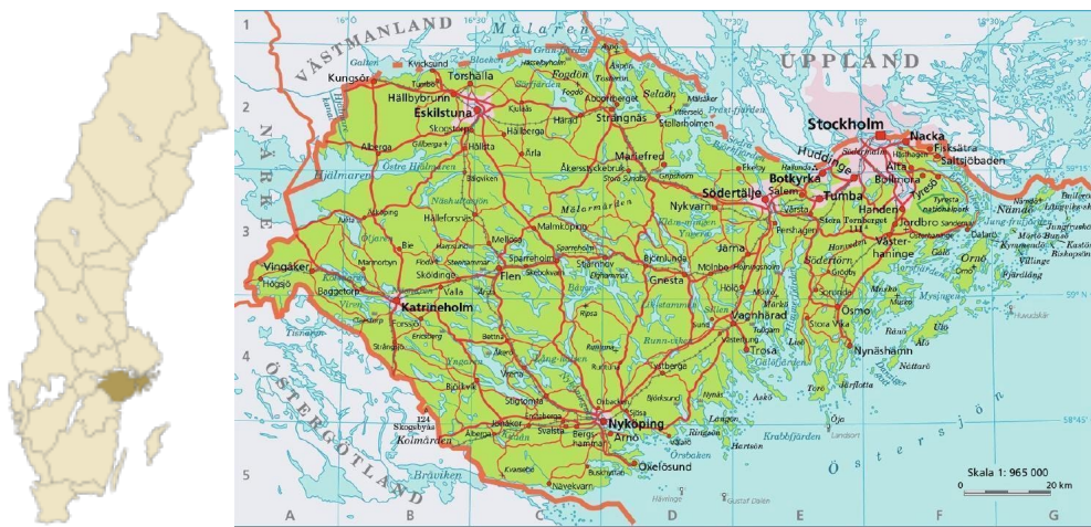
Figur 5. Landskapet Södermanland i mellersta Sverige.

"Åkeröpple från Sörmland" odlas inom det geografiska området landskapet Södermanland (figur 5).