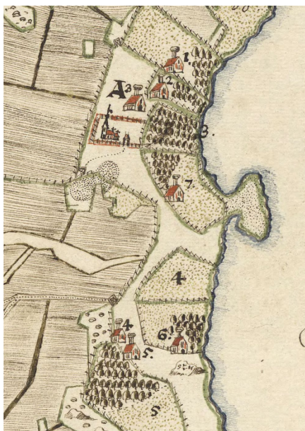
Figur 6. Fruktodlingar på de södermanländska Mäläröarna år 1640. Redan vid denna tid odlades frukt för avsalu till huvudstaden.

Under flera århundraden tilldelades, var tids maktelit, stora gods i Södermanland som belöning för insatser för riket och kungamakten. Den feodala maktordningen och de stora godsen utgjorde förutsättningar för mycket av det som idag ses som särpräglat sörmländskt. De stora gårdarna var uppbyggda som samhällen med stor arbetsstyrka. Det skapade förutsättningar för ett mångsidigt nyttjande av landskapets variation. Allt fanns och inte minst omfattande fruktodlingar. Skickliga trädgårdsmästare hade hög status och det är sannolikt ett skäl till att Södermanland har flest äldre kultursorter av äpplen bevarade. Ofta är de döpta efter namnet på den gård där de förädlats fram av skickliga hantverkare.