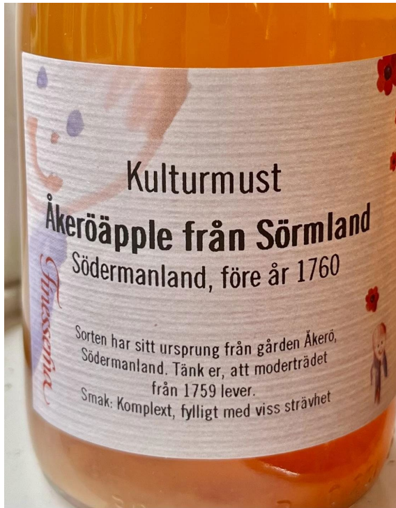
Figur 4. Must av "Åkeröäpple från Sörmland" klar för försäljning

Must produceras endast av råpressade äpplen av "Åkeröäpple från Sörmland". Mustning av frukt sker tidsmässigt i nära anslutning till skörden. Det har betydelse för produktens organoleptiska kvalitet och ger en smakprofil som ligger nära den färska frukten. Av samma anledning är det viktigt att tiden mellan pressning och tappning av must i dess förpackning är kort.