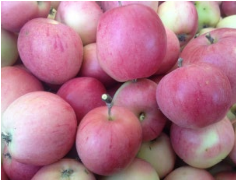
Figur 1. "Åkeröäpple från Sörmland"

Kärnhus: Stort till medelstort, rundat till lökformat, öppet. Kärnrummen är regelbundet formade med ritsadeväggar. Av de kastanjebruna kärnorna är några rätt små och runda-droppformade, övriga är rudimentära. Gröna, gula eller röda kärldrängar. Storlek: Medelstor till stor. Betydande storleksvariation, mellan 50 mm och 140 mm diameter. För merparten av välutvecklad frukt är storleken mellan 70 mm och 100 mm. Kött: Gulvitt, grymig, fast, kort, saftigt, sött, syrligt, ibland glasigt. Hög arom. Oxiderar snabbt. Socketinnehåll: 12-20 °Brix. Socketinnehållet ökar med framskriden mognad och varierar något mellan år. Smak: Sött, mildt syrlig och aromatiskt. Balanserad fyllighet, från söt till mycket söt men med en balanserad syra, aromatisk kryddig rik smak med en mycket lätt beska i eftersmaken. Sensoriskt går det att finna smaker såsom mineralitet, mylla, klorofyll, örtighet, utvecklad frukt, viss sälta. De fullt mogna frukterna har eteriska toner som kan förknippas med exotisk frukt. Doft: Doften från skalet är stramt fräsch med träigt inslag, fruktköttet doftar fruktigt kryddigt mot kanel med ett kärnhus som doftar moget blommigt.