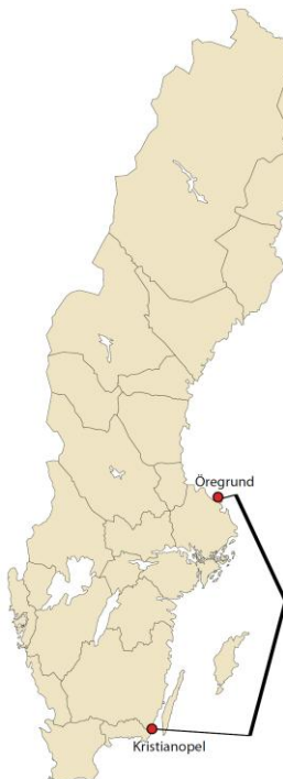
Figur 1. Det geografiska området sträcker sig från Kristianopel i söder till Öregrund i norr.

Det geografiska området avgränsas i söder av Kristianopel i Kalmarsund och en rakt östlig linje till gränsen för den svenska ekonomiska zonen, i öster av den svenska ekonomiska zonen (i figur 1 markerad i fet heldragen linje), i norr av en rakt östlig linje från Öregrund till den svenska ekonomiska zonen och i väster av kuststräckan och dess samhällen (d.v.s. även landet närmast havet – 1 km in i landet ingår i det geografiska området).