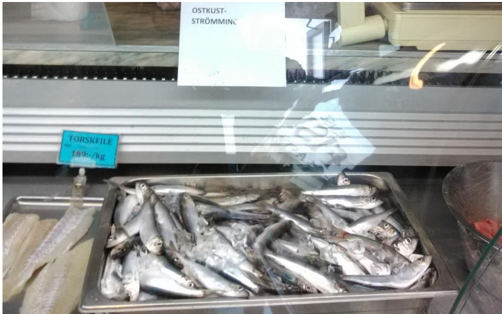
Figur 3. Färsk "Ostkustströmming" till salu i fiskaffär på Gotland.