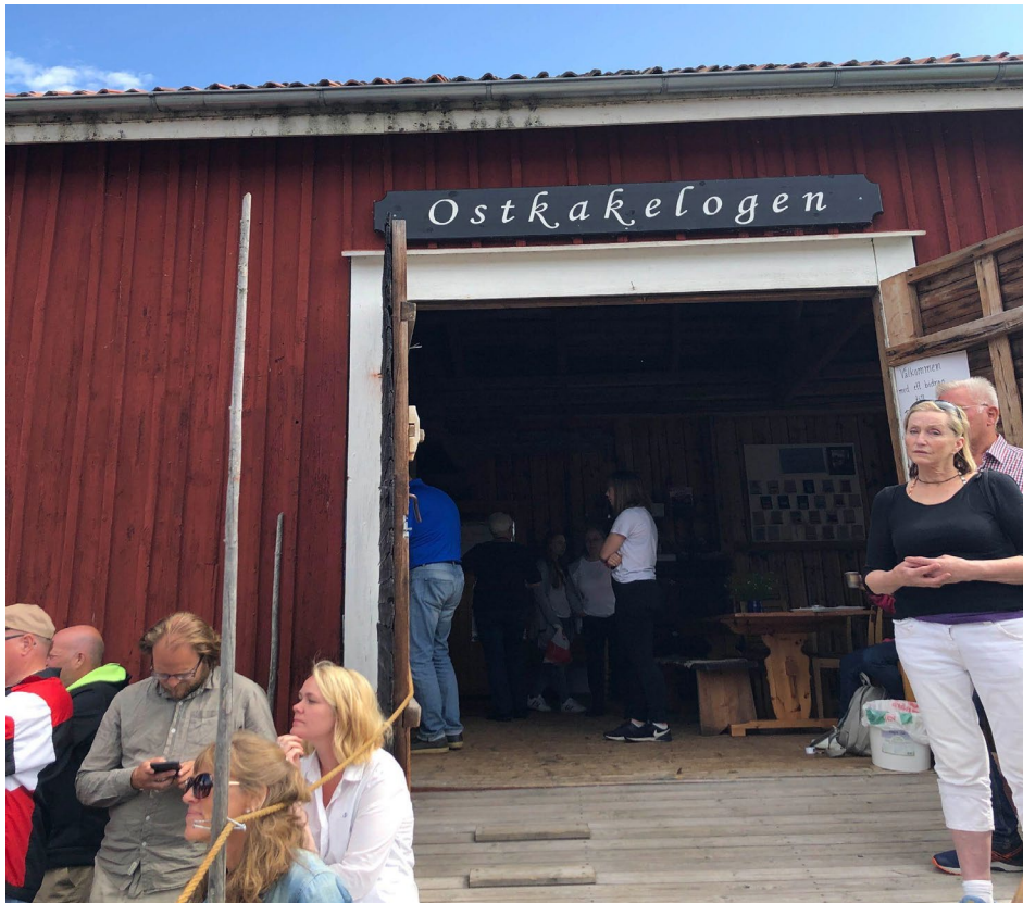
Bild 2. Ostkakeloge med servering av Hälsingeostkaka på Forsa Forngård.