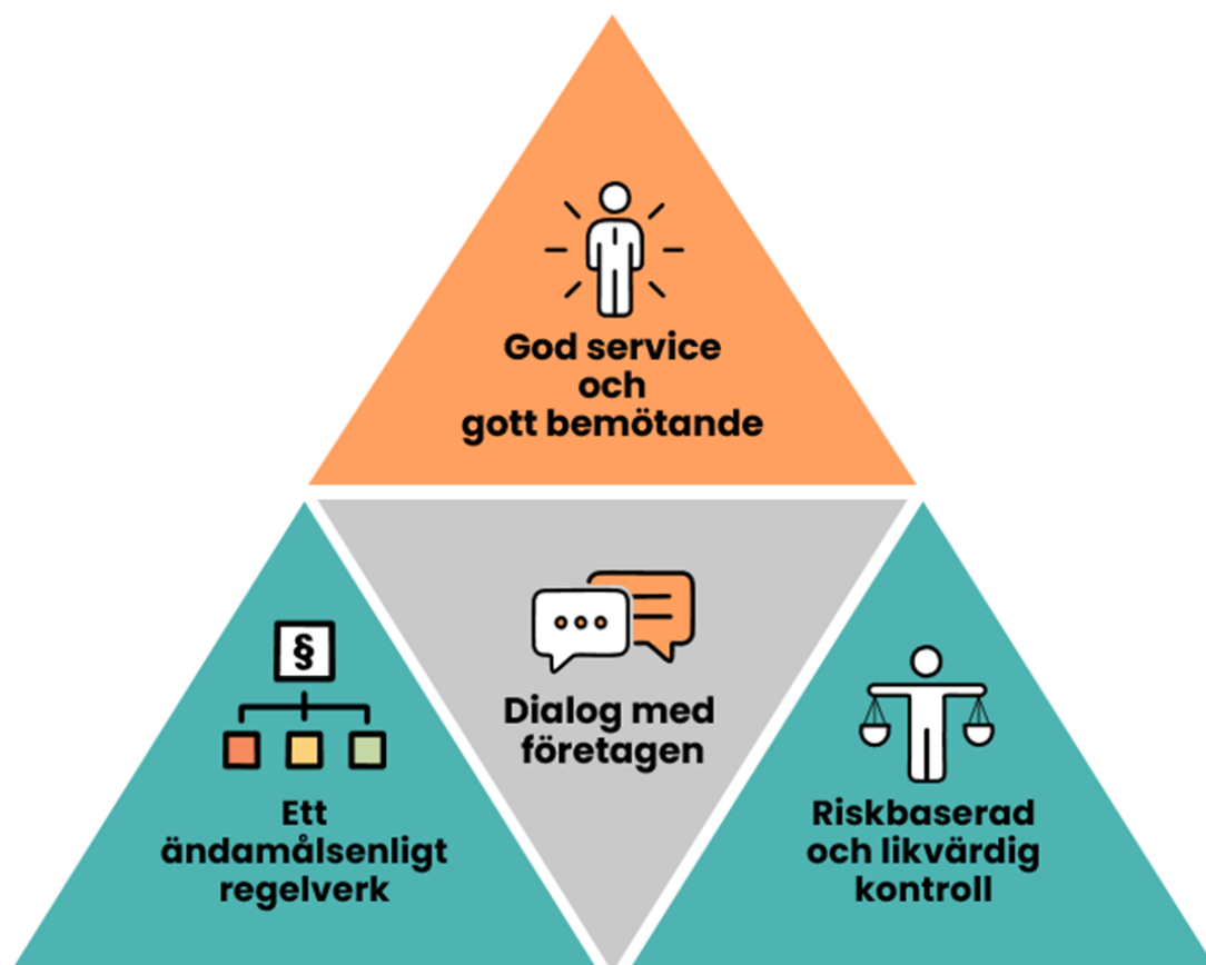
Figur 1. Fyra fokusområden för Livsmedelsverkets företagsarbete, God service och gott bemötande, Dialog med företagen, Ett ändamålsenligt regelverk och Riskbaserad och likvärdig kontroll.